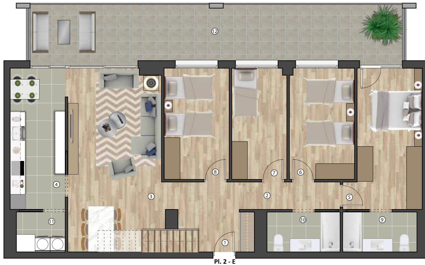
Pl. 2 - E