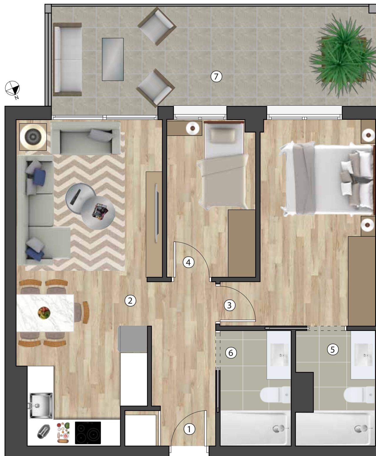
Pl. 1 - B