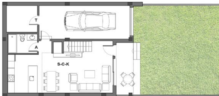
Planta baja ESCALA 1/100