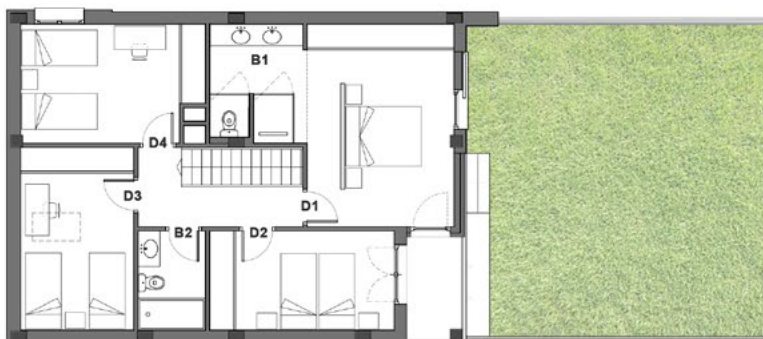
Planta primera ESCALA 1/100