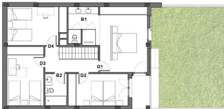
Planta primera ESCALA 1/100