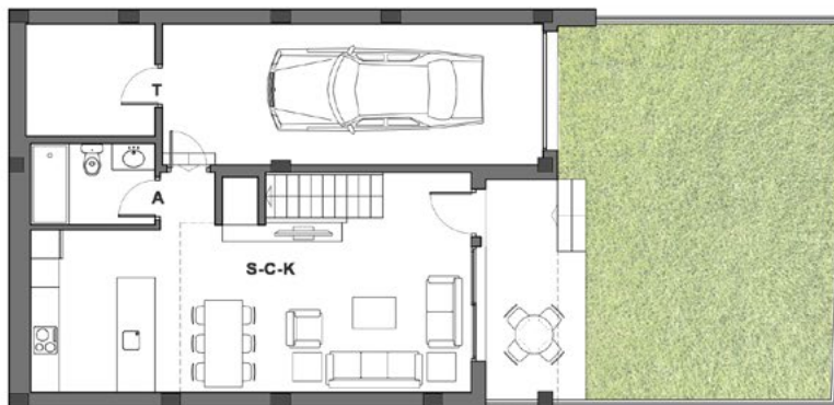
Planta baja ESCALA 1/100