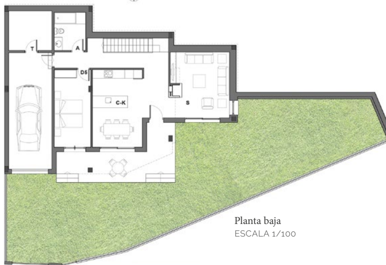
Planta baja ESCALA 1/100